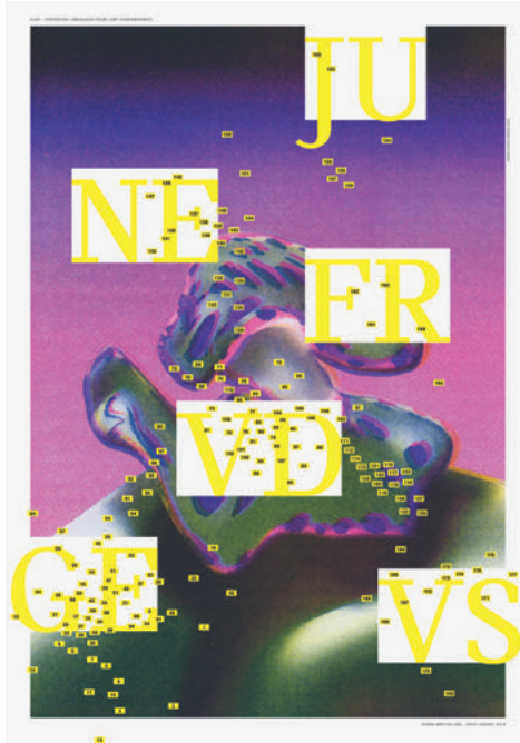
Illustration : Flora Mottini. Graphisme : Studio Frédéric Held